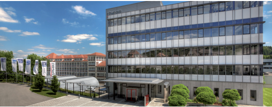
CHIRON Werke in Tuttlingen

CHIRON wurde 1921 als Handwerksbetrieb gegründet und ist heute mit seinen CNC-gesteuerten, vertikalen Fertigungszentren und den darauf basierenden Turnkey-Lösungen ein in diesem Bereich weltweit führendes Unternehmen. Fertigungssysteme „Made by CHIRON“ sind in allen metallverarbeitenden Branchen, sowohl in kleineren und mittleren, als auch in großen Unternehmen 1. Wahl, vor allem, wenn es um die qualitativ hochwertige Zerspannung komplexer Werkstücke zu minimalen Stückkosten geht.