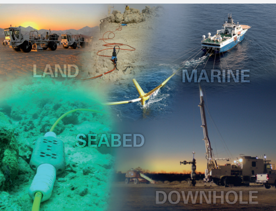
Les équipements Sercel sont adaptés aux environnements extrêmes

Les équipements conçus et fabriqués par Sercel sont le résultat de l'investissement de collaborateurs passionnés par l'innovation. Le principal centre de R&D et le siège social de Sercel sont situés à Nantes, en France.