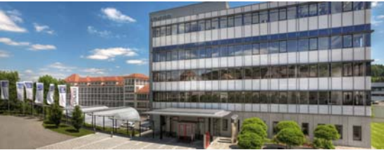
CHIRON Werke in Tuttlingen

CHIRON wurde 1921 als Handwerksbetrieb gegründet und ist heute mit seinen CNC-gesteuerten, vertikalen Fertigungszentren und den darauf basierenden Turnkey-Lösungen ein in diesem Bereich weltweit führendes Unternehmen. Fertigungssysteme „Made by CHIRON“ sind in allen metallverarbeitenden Branchen, sowohl in kleineren und mittleren, als auch in großen Unternehmen 1. Wahl, vor allem, wenn es um die qualitativ hochwertige Zerspannung komplexer Werkstücke zu minimalen Stückkosten geht.